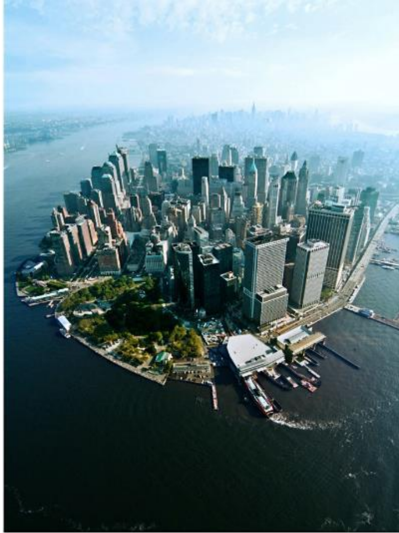
Manhattan (New York) oggi