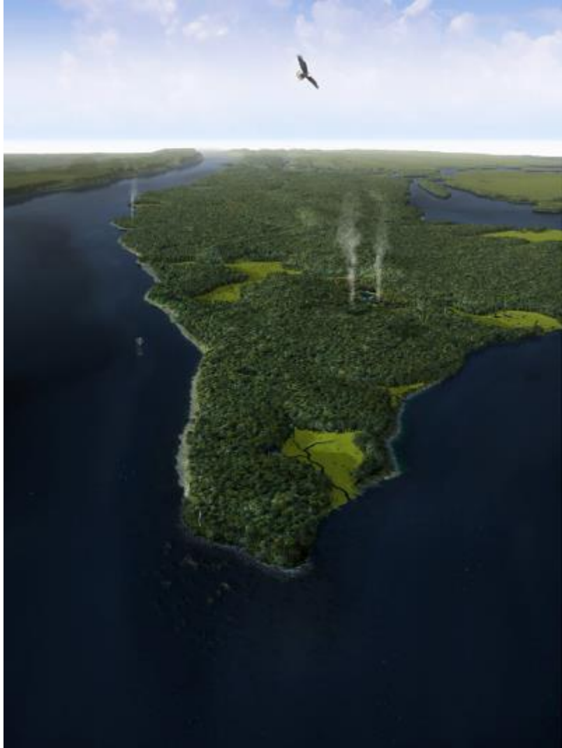
Manhattan prima dell'arrivo degli europei