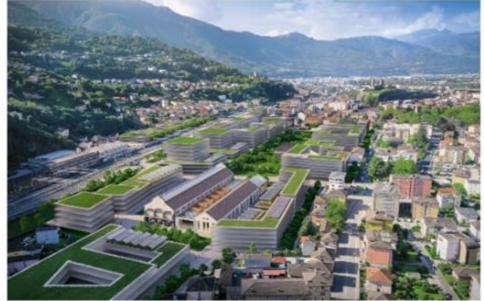
Progetto area ex Officine a Bellinzona