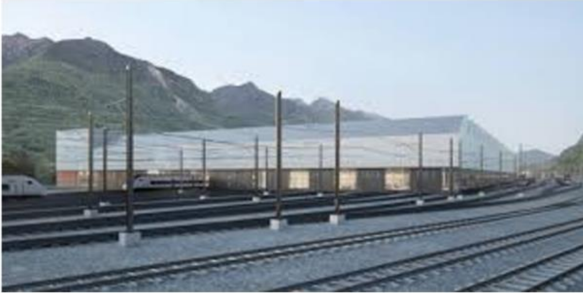
Futura Nuova Officina FFS a Castione